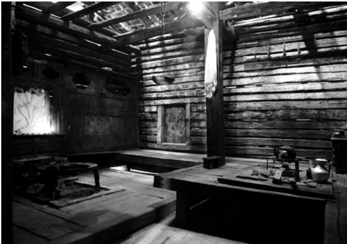
The Reconstruction of the Communal House of the Qiau Zi Family, 2008

Mathilde ter Heijne: Long live Matriarchy!