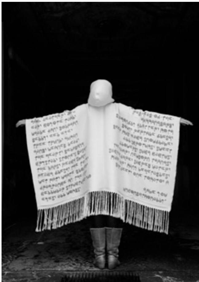
Red, Black, Silver and White , 2009

ste collectie, Goddess , bestaat uit in totaal negen poncho's die voorzien zijn van geometrische patronen afkomstig uit oude Oost-Europees symboolsystemen die voorafgingen aan het alfabetische schrift. Prehistorica Marija Gimbutas toonde in haar boek "The Language of the Goddess" (New York, 1989) aan dat de neolithische, magische symbolen bewijs zijn voor de dominante status van de godin boven de god en van een overwegend matriarchaal geordende sociale structuur in de vroege mensheidsgeschiedenis.