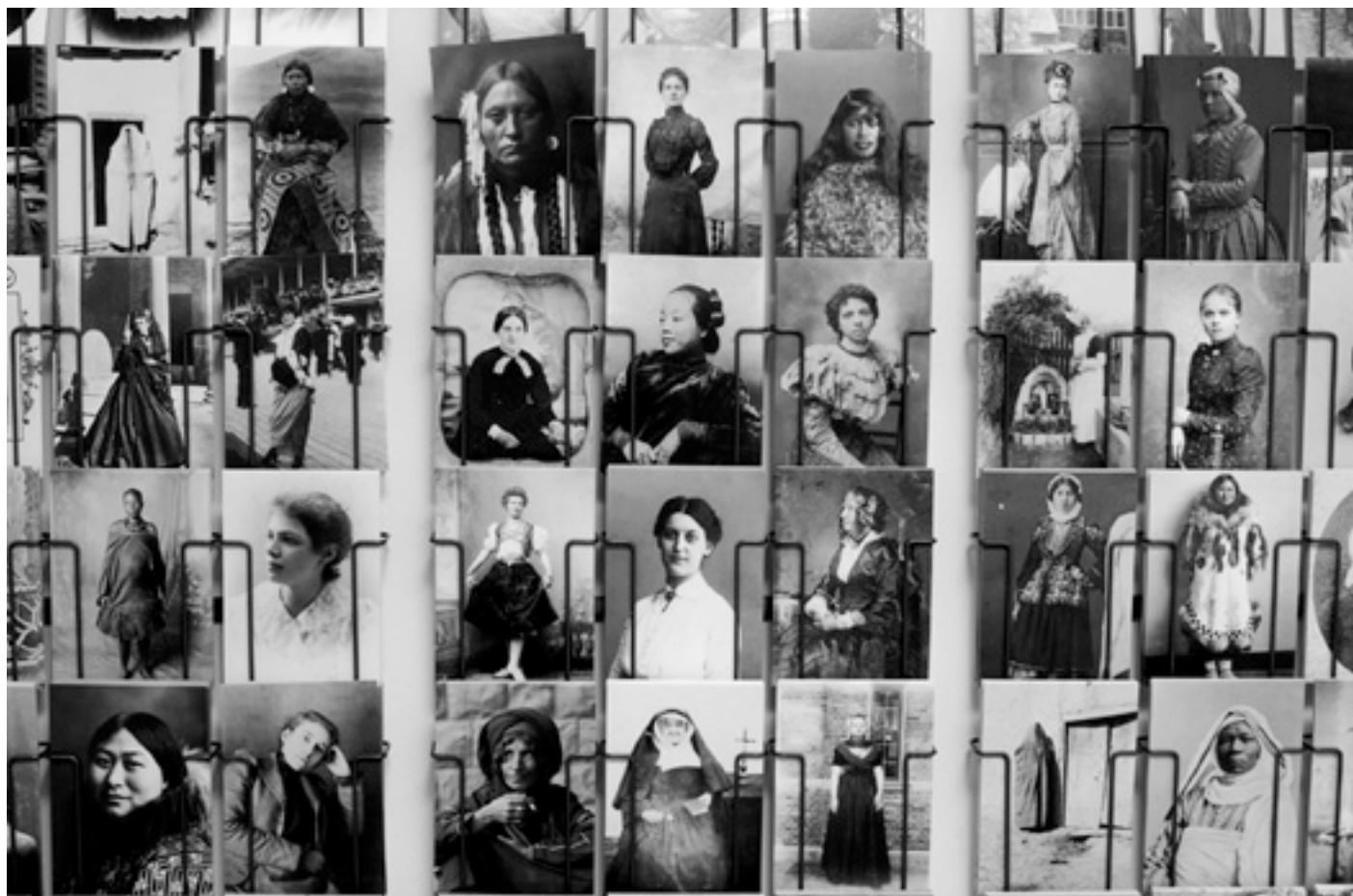
Women to Go, 2005-2007