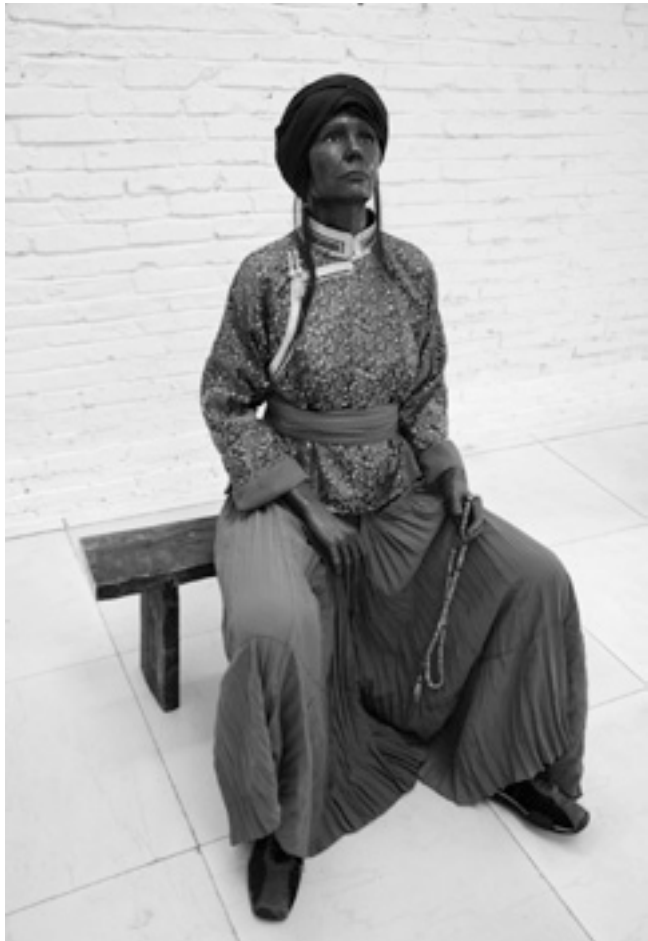
Foremother Worship , 2007