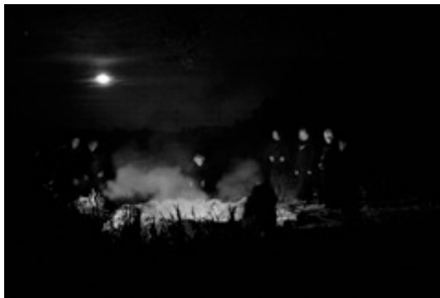
Moon Rituals, 2007 (Courtesy Arndt&Partner, Berlin;)