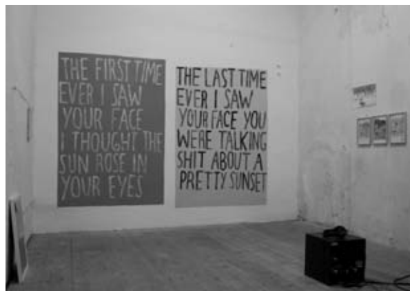
Hey Hey, My My, 2008, installation-view