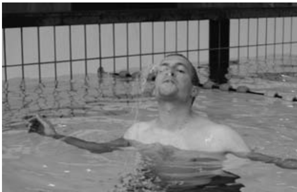
Self-Portrait as Fountain (After Bruce Nauman), 2007