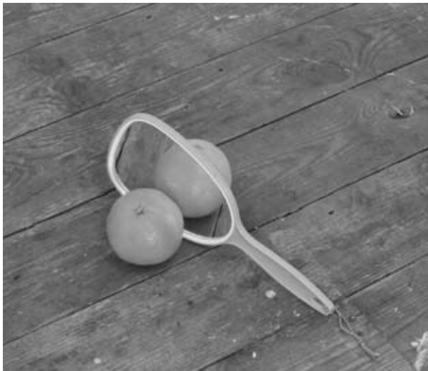
Untitled , 2008