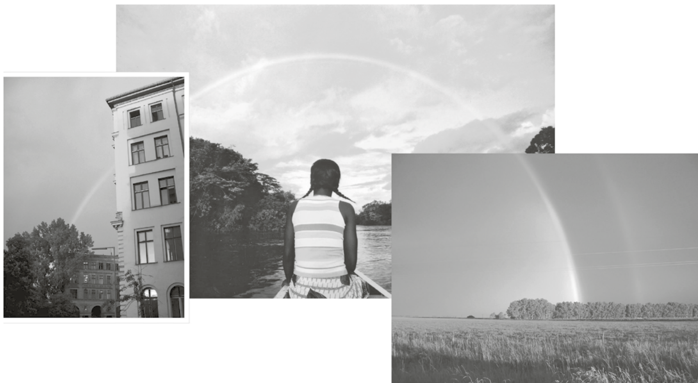
Amalia Pica, Grayscale , 2007