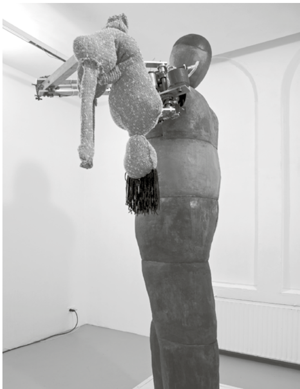
Gal Kinan, Father , 2006

hurls around a loosely knitted girls' doll. The pre-programmed movements of the figure initially appear violent, but in their repetition, they reveal an undisclosed tragedy: the inability to break free of the decorum of traditions. Her latest video work Reviving Pleasure (2007) shows the feminine side of