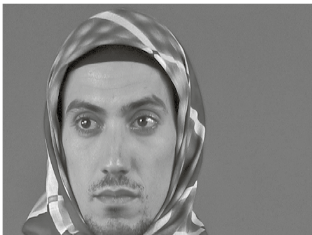
Köken Ergun, Untitled , 2004, video stills

22 juli - 9 september, 2007 Opening: 21 juli, 17-19 uur