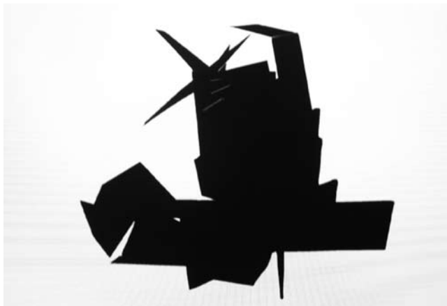
Falke Pisano, Object and Disintegration: The Object of Three (The Creative Subject) , 2008, videostill

Krist Gruijthuisen is curator of the exhibition