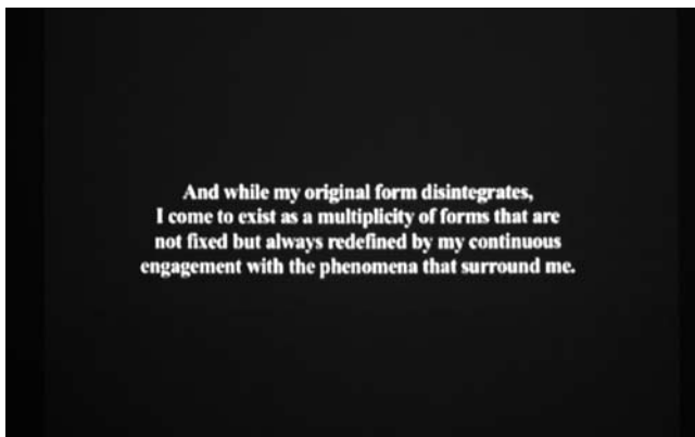
Falke Pisano, Object and Disintegration: The Object of Three (The Engaging Spectator) , 2008, videostill

It is the setting of the supporting structure, which first enables the object to go from an invisible to a visible realm; which subsequently provides the conditions for its reception as a consistent and solid unit, and which will finally instigate the disintegration of the object.