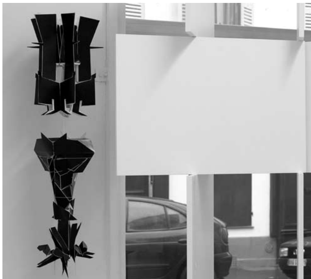
Falke Pisano, L'objet complet (The undeniable success of operations) , 2008

Luca Frei's slide projection is linked to Pulfer's investigation and consists of a loop of 21 slides. Each slide shows a sentence from Ivan Illich's book Deschooling Society , such as: 'In the evening the villagers meet for the discussion of these key words. They begin to realize that each word