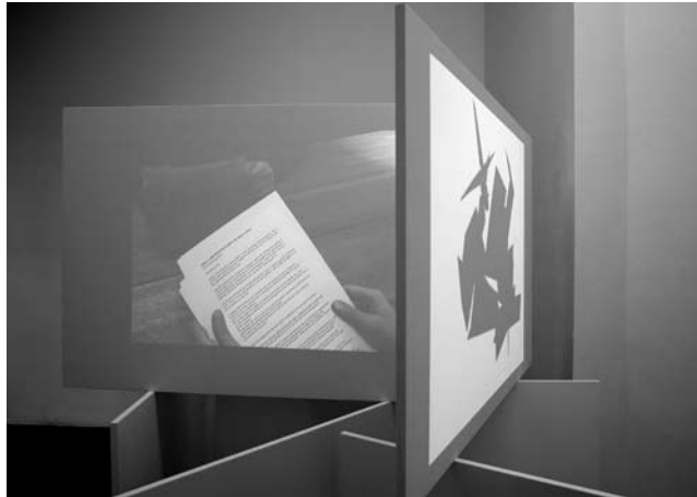
Falke Pisano, Object and Disintegration: The Object of Three , 2008

Specific core elements reappear in Pisano's production. These elements are first the use of language