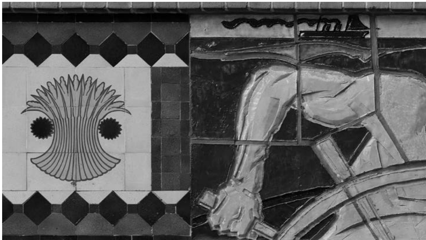
Zachary Formwalt, An Unknown Quantity , 2014, single-channel HD video installation, duration: c. 35'