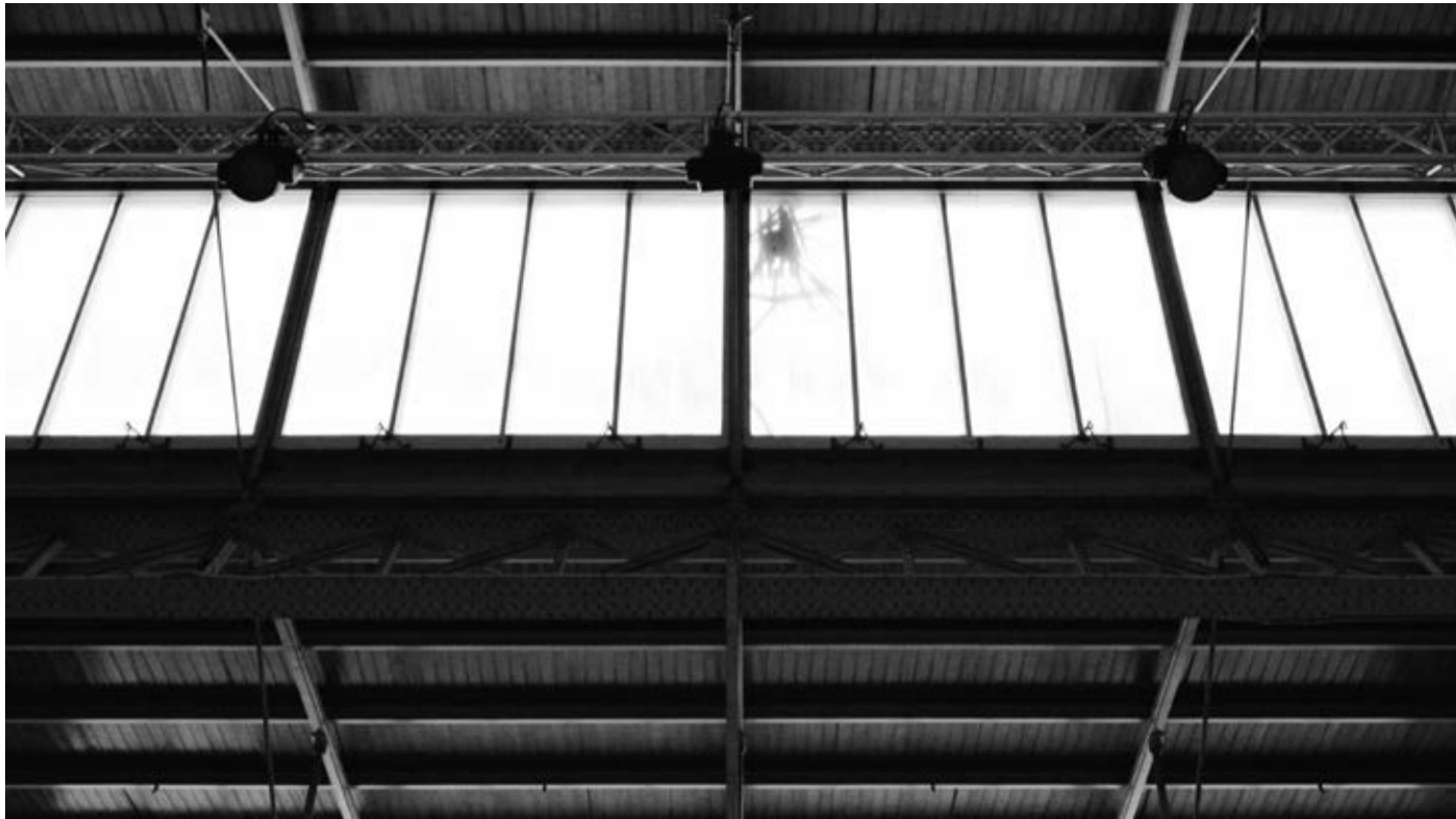
Zachary Formwalt, An Unknown Quantity , 2014, single-channel HD video installation, duration: c. 35'