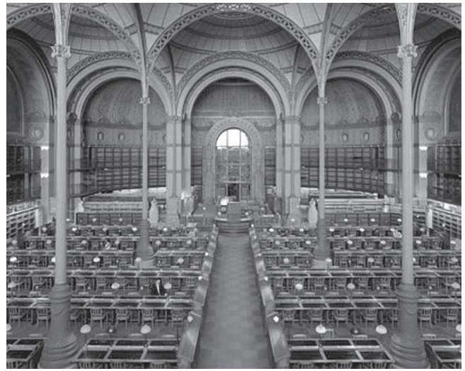
Toute la mémoire du monde, 2006 (photo)