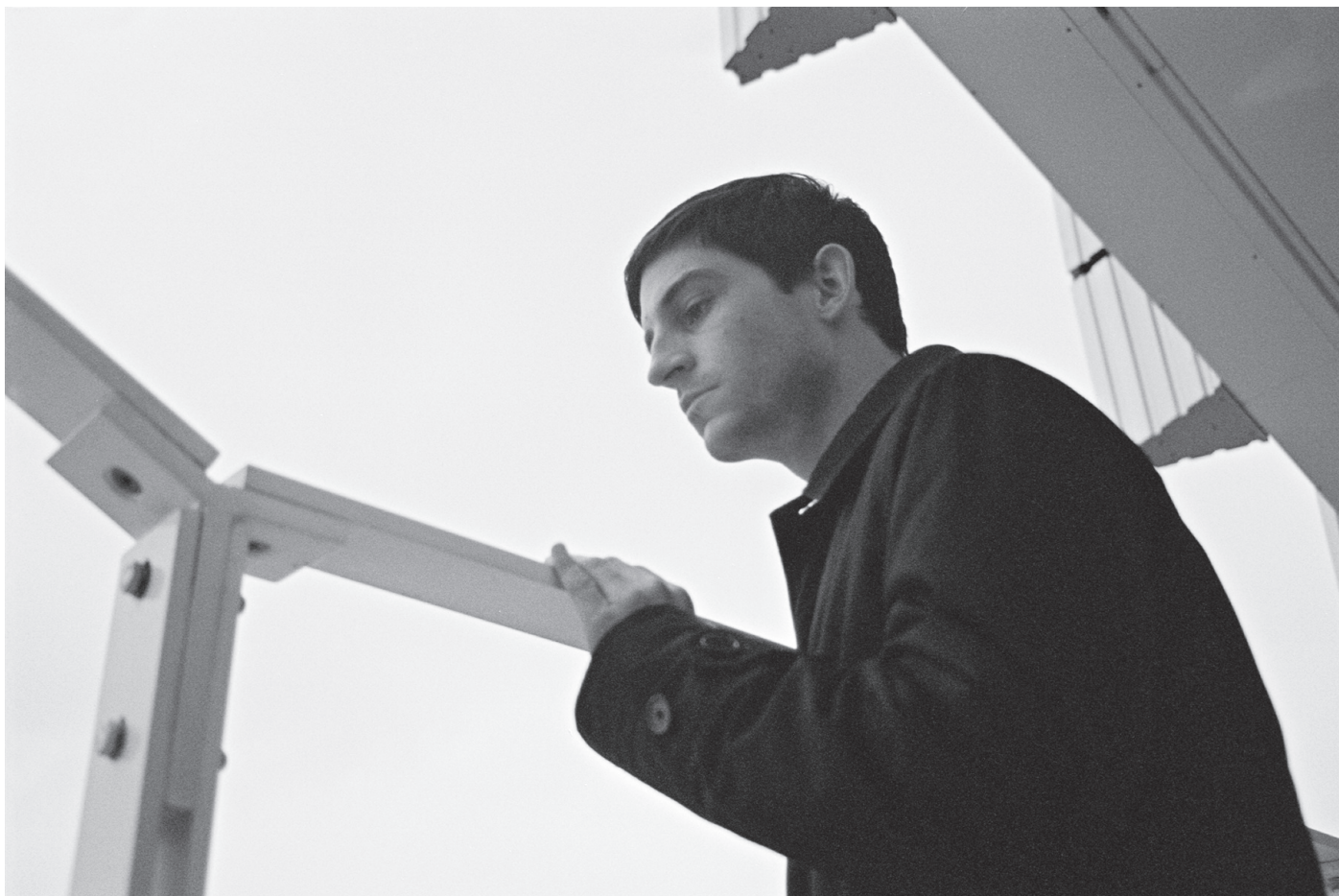
The Rise, 2006, production still