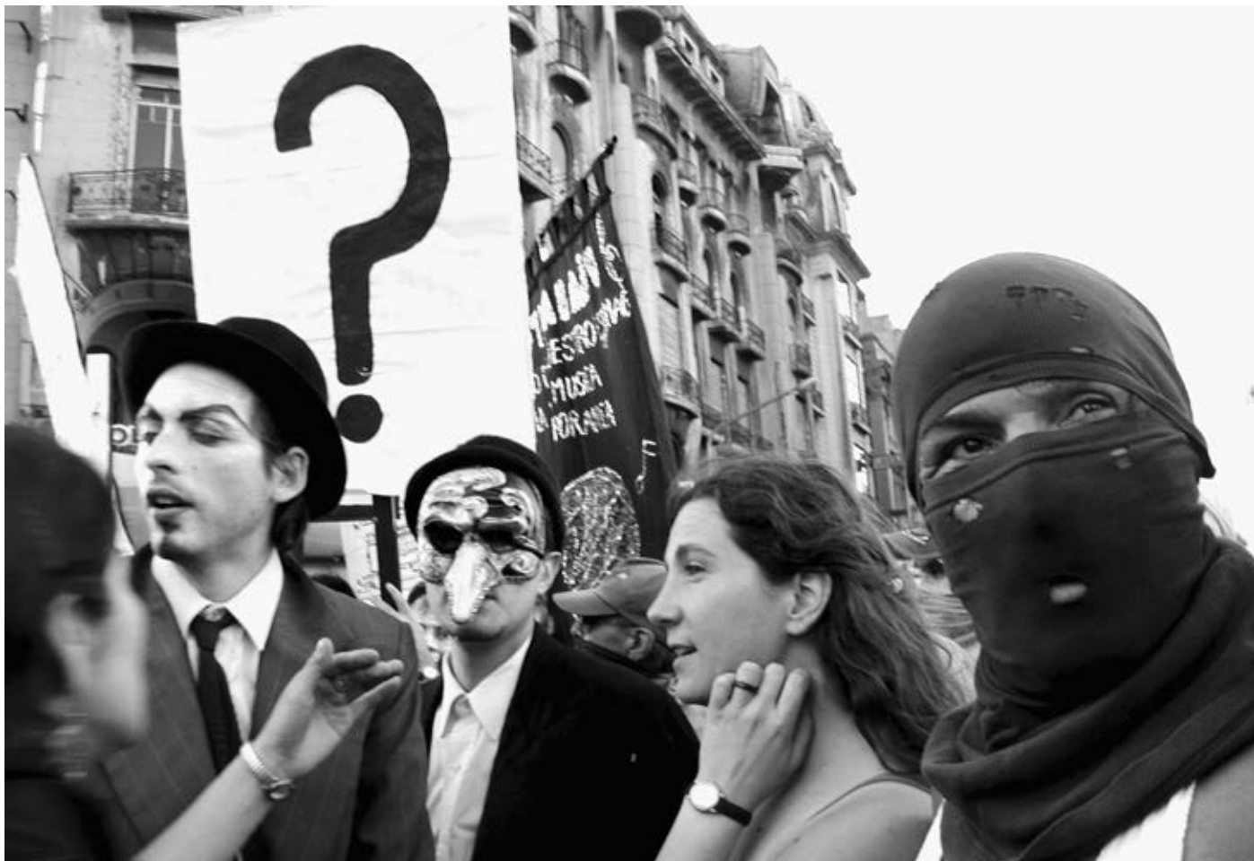
Etcetera..., Con-Trabajo o (Sin) Fonia , 2004 (Performance in Buenos Aires)