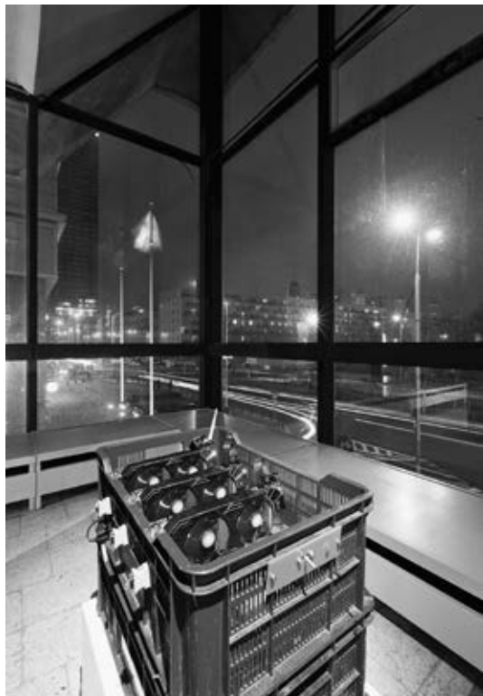
Goldex Poldex (Janek Simon and Janek Sowa), LTC Miner , 2014

Poldex with the opportunity to mine their own money, without actually having to work for it. Simultaneously, it constitutes one of their strategies to create an alternative funding model for cultural production, one that does not depend