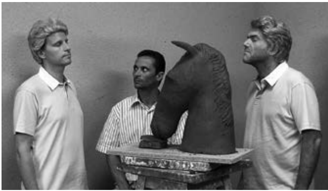
Jos de Gruyter & Harald Thys, Der Schlamm von Branst , 2008 (Videostill)

be seen as a precondition to finding, or even searching for a new direction, and as such is a locus for the impetus to create something new. The sculptural work departs from the formalism of amateur pottery. The artists developed a humorous figuration based on the re-elaboration of the expression of the inner self. As such, the roughness of their sculptural approach can be seen as a post-ironic comment on the contemporary aim for perfection, and the sleekness of the industrially manufactured items of our ever-producing societies.